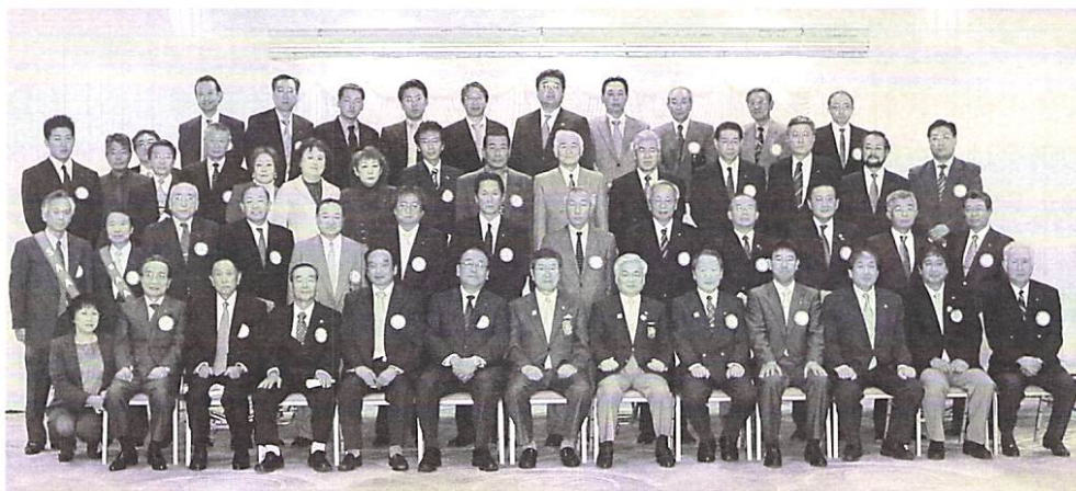
10月16日合同例会 ガバナー公式訪問