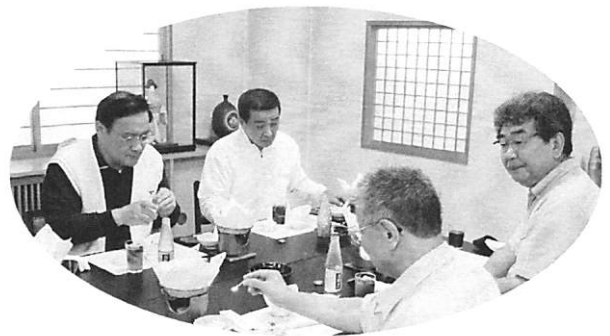
(会報担当者：弗田 和則 委員長)