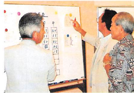
右から泉委員長、小川委員、成田委員

結果発表…ところがこのあと クレーンが。 優勝はCテーブルか？ それとも大逆転か？