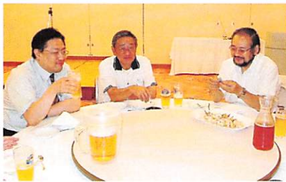
おいしい料理が続々と…。

結果発表…ところがこのあと クレーンが。 優勝はCテーブルか？ それとも大逆転か？