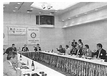
懇 親 会