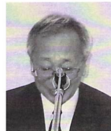
会計 新 博夫 会員