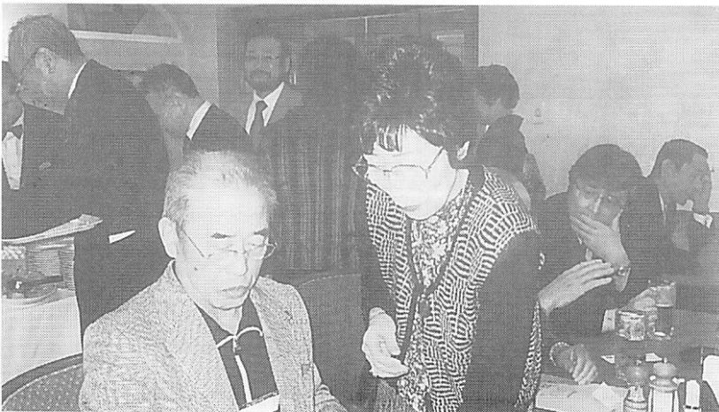
(会報担当者：弗田 和則 委員長)