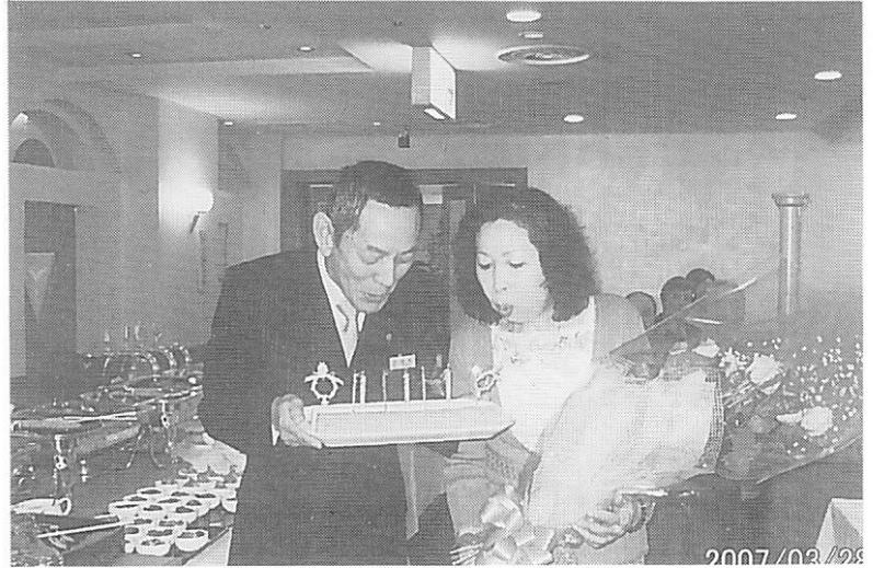
茂木会員夫妻へケーキ贈呈