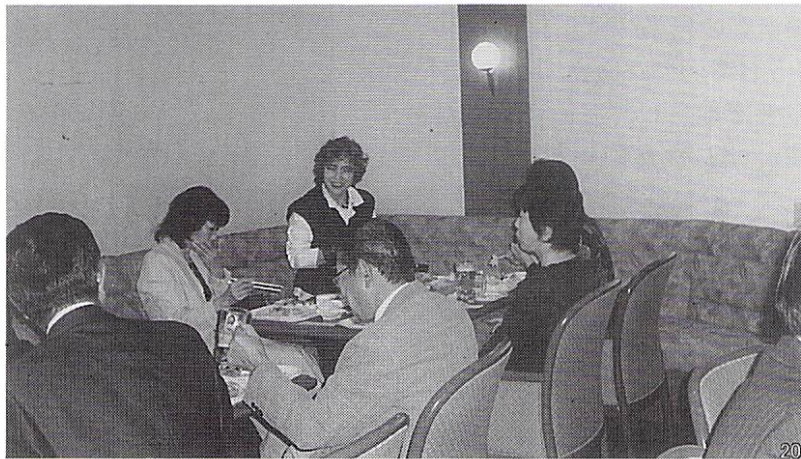
9月27日 夜間例会(ディナーバイキング家族会)