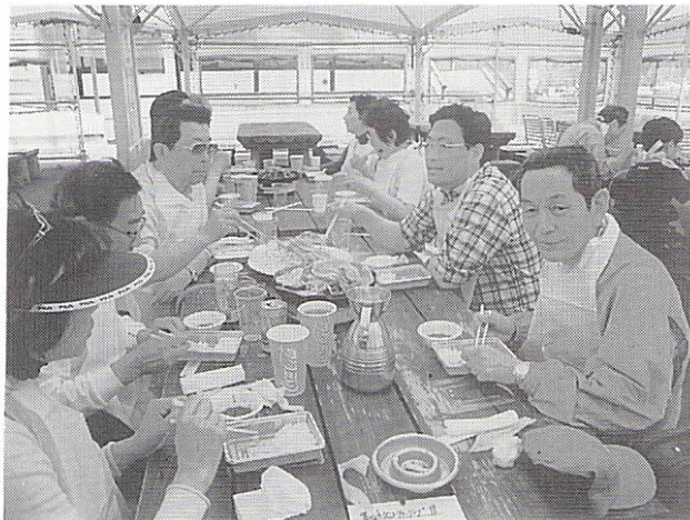
5月21日 移動例会 グリーンピア大沼