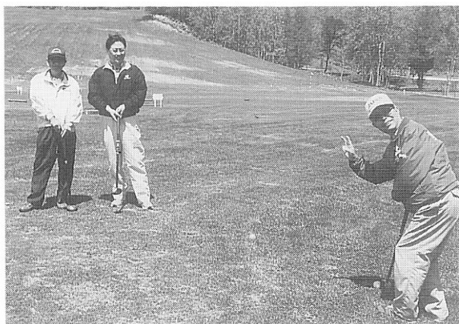
5月21日(日) グリーピア大沼にてレクリエーション