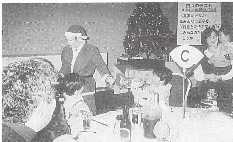
12月21日夜間例会「クリスマス家族会」