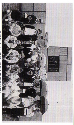
早朝例会（七重浜 洞爺丸慰霊碑前部）