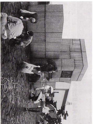
(会報担当者：佐々木 公和 委員)