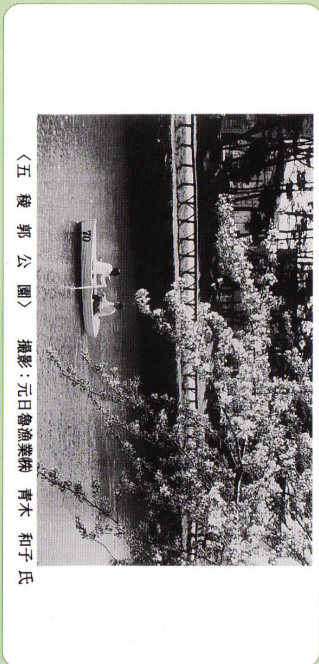
〈五稜郭公園〉