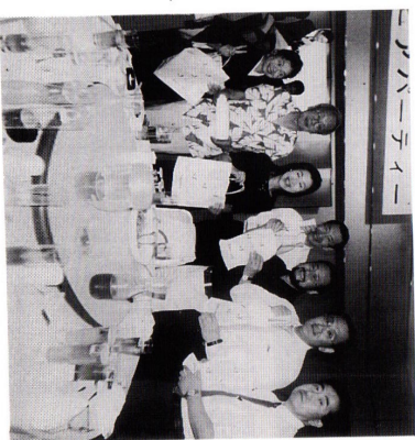
(会報担当者：柴前 雅夫 委員)