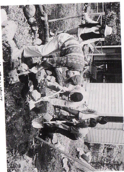
ガーデンソングに汗