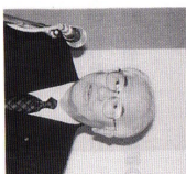
(会報担当者：石橋 輝夫 委員長)