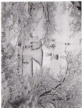
〈ハリストス正教会〉