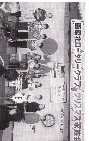
ナンタクロースは高坂会員です。ごころ様！