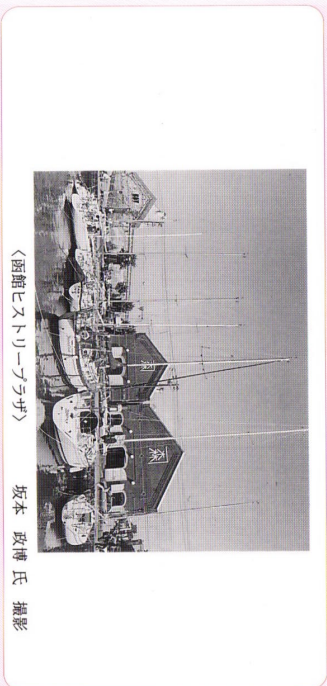
〈函館ヒストリーツアー〉