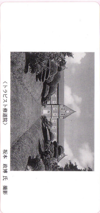
〈トホビスト修道院〉