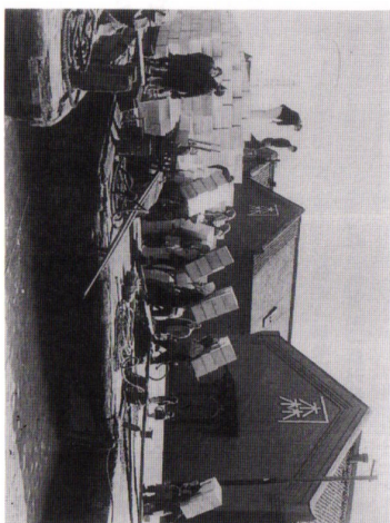
はしけの積み込み作業。昭和30年代

函館北ロータリークラブのホームページ http://www.hakodate-north.org/