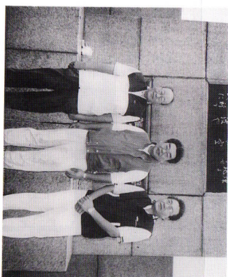
(写りの悪いのは台風のせいです)