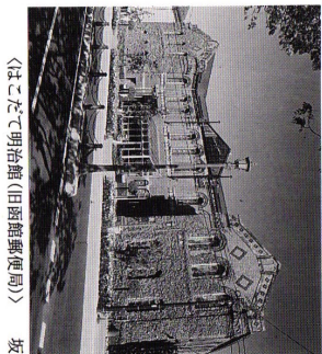
〈はこだて明治館(田原館郵便局)〉