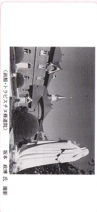
〈函館・ホリスチス修道院〉