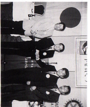
新・旧 会長・幹事

例会場：函館 国際ホテル 〒040-0064 函館市大手町5-10 TEL23-5151 例会日：毎週水曜日 12:30～13:30 事務局：函館市大手町5-10 ニチロビル4F TEL23-3870