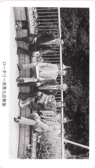
ロータリー-世界大会参加