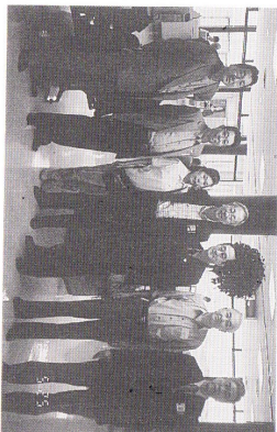
ロータリー-世界大会

私は、台湾・シガポール、今回と3回目の参加ですが、ポール・ハリス・フェローには120カ国から約1,000名が参加をいたしました。