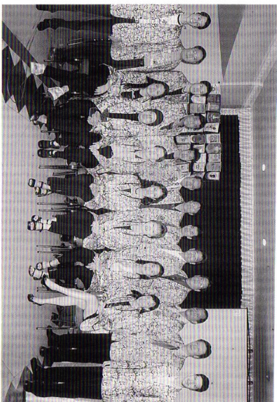
イントロソシア タマソサロータリークラブ会員の皆さん

次々週はクラブ創立40周年記念式典です。今日雨が降った分、21日はきつと晴れてくれることを信じています。雨の中おつかれさまでした。