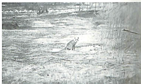
「庭には北キツネもいます」