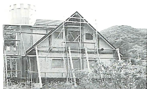
「屋上には露天風呂もあります」