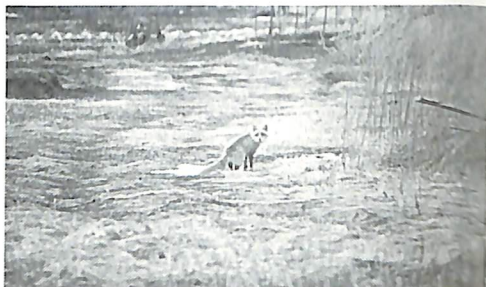
「庭には北キツネもいます」