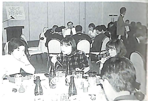
(会報担当者：成瀬 一徳 委員長)