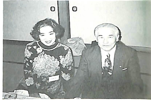
小笠原会員ご夫妻