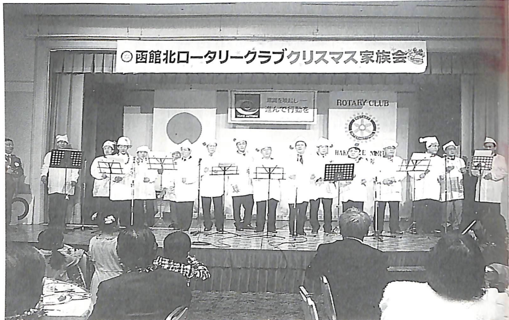
(会報担当者：今井 定一 委員)