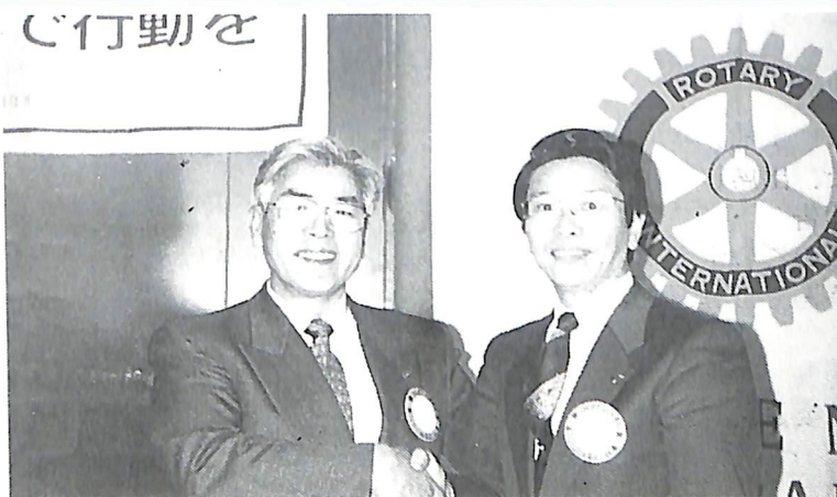
12月6日 松見会長と次年度会長薮下副会長