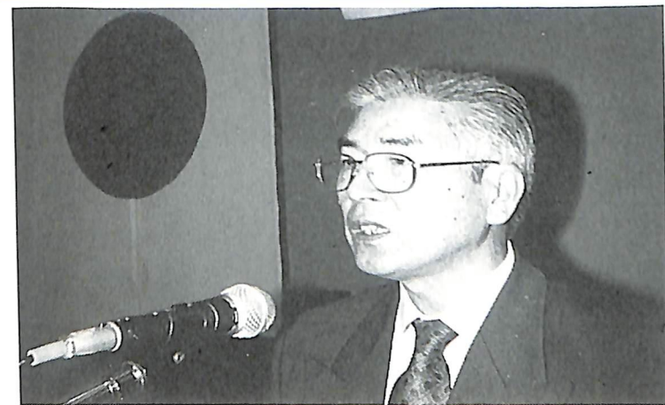
12月13日 クラブアッセンブリーでの会長報告