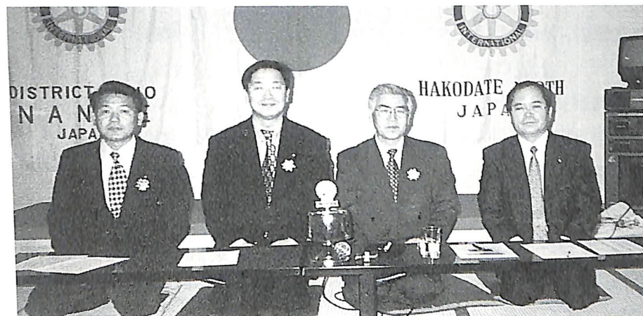
11月15日 七飯R.C.と合同夜間例会