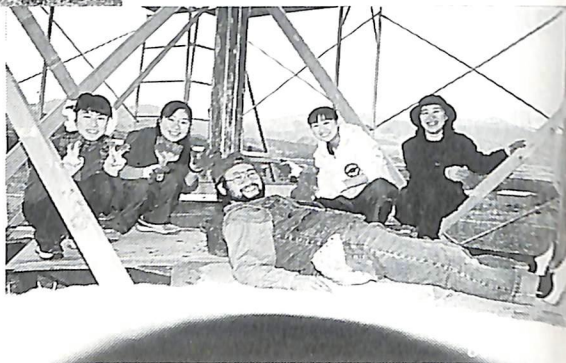
(家族も休日返上で おてつだい…………!!)