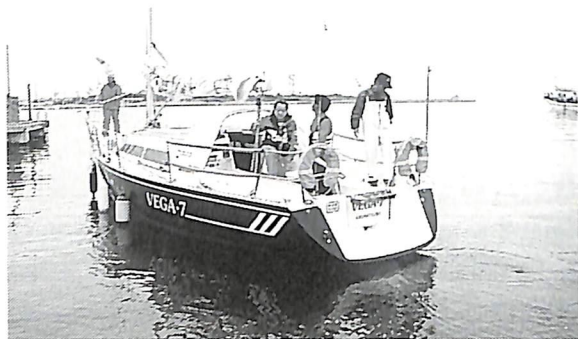
「朝5時 いよいよ新潟に向け出発」