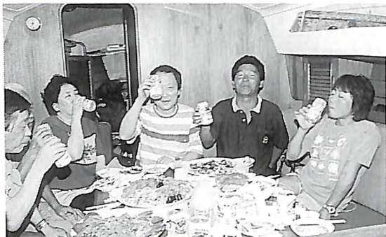
「ベガ7のキャビンでクルーの ウェルカムパーティ