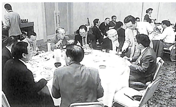
(会報担当者：松浦 次男 委員)