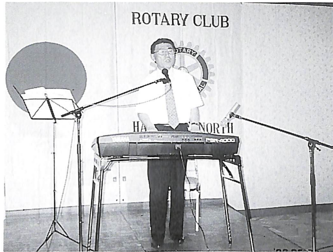
(会報担当者：佐々木公和 委員長)