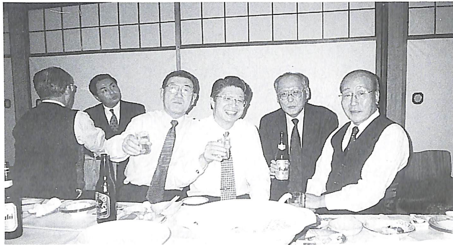
(会報担当者: 竹谷 満 委員)