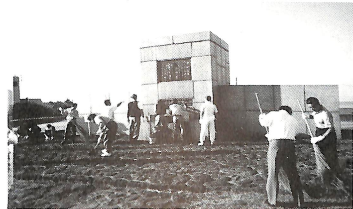
9月9日早朝例会 七重浜慰霊碑清掃