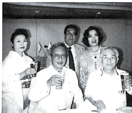
納涼ビアパーティ