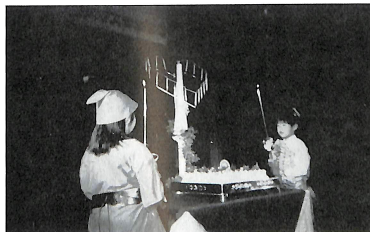
12月24日 クリスマス家族会