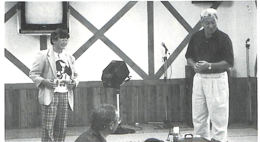
10月5日野外家族会（ワールド温泉牧場）