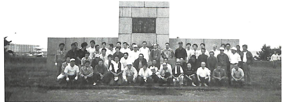
9月10日早朝例会(七重浜慰霊碑清掃)