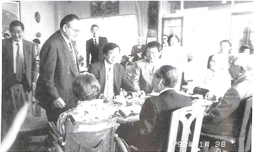
菅 直人前厚生大臣来訪、入居者らと談笑

「おとしよりに太陽を」という本が去年の12月に出版された。これは、労働旬報社という出版社の方がホームを見学に来て話を聞いたら是非本にしたいということで、3日間ホームに来て、私の話を録音してまとめたものです。この本は辛口の話がうけたのか大きな反応があり、第一版の6,000部は2～3週間で売れて、今は第2版が終わるところです。