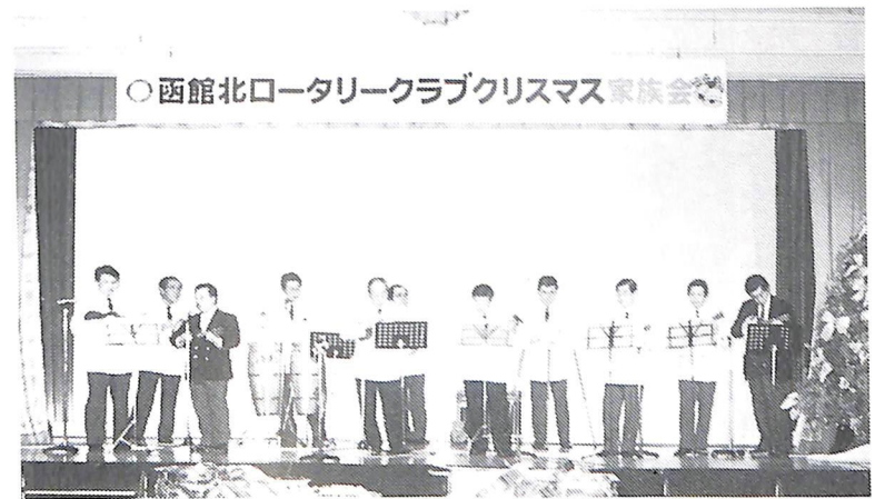
12月25日 クリスマス家族会