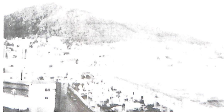
10月9日 早朝例会 (函館国際ホテル9階より望む臥牛山)