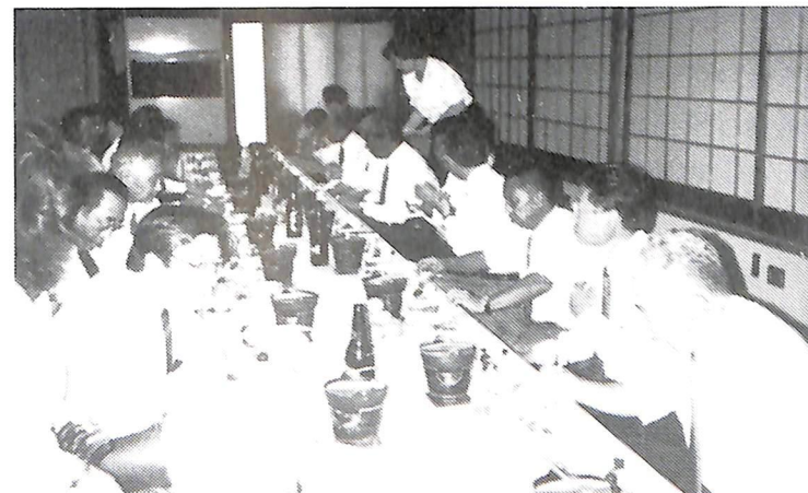
9月18日夜間例会 (兼クラブアッセンブリー)