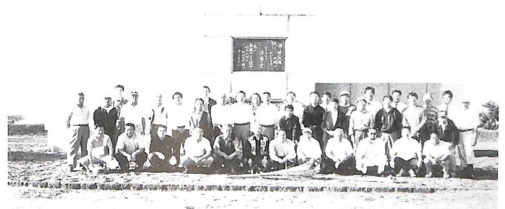
9月11日早朝例会「七重浜慰霊碑清掃」