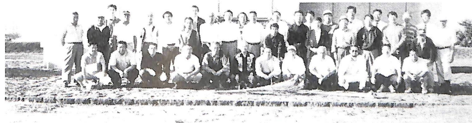
9月11日早朝例会「七重浜慰霊碑清掃」