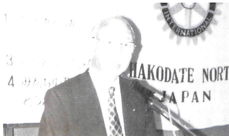
7月24日 ガバナー公式訪問