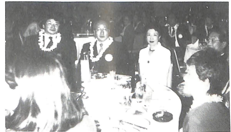
12月21日 クリスマス家族会