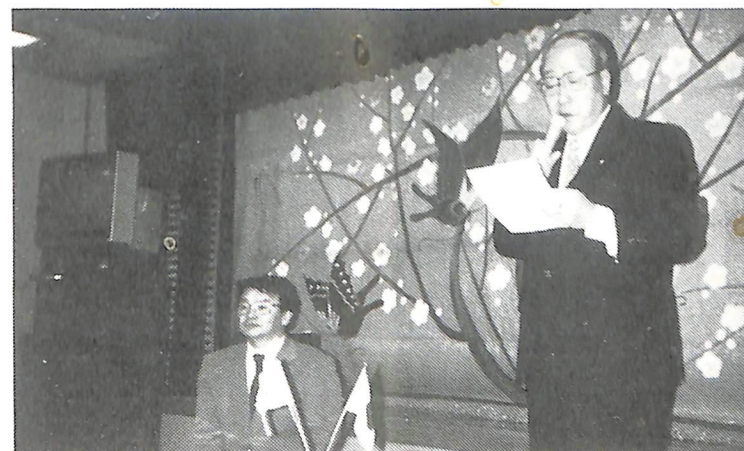
1月10日 “新年交礼会” 会長挨拶