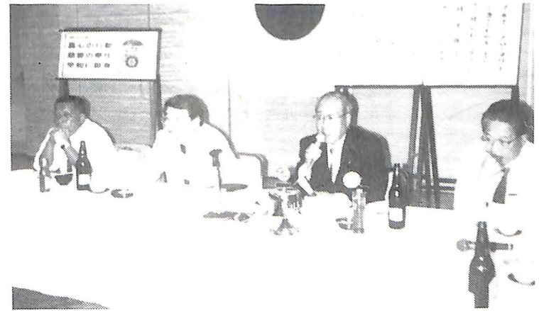
10月25日 クラブアッサンブリー