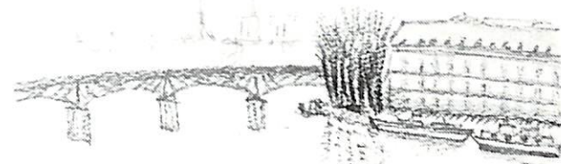
「セーナ川」 椎谷 龍彦 会員