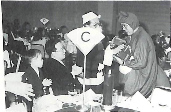
クリスマス家族会