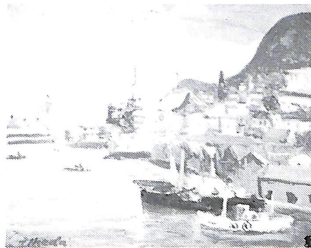
函館港風景(昭和47年作)故池田甚三郎画伯